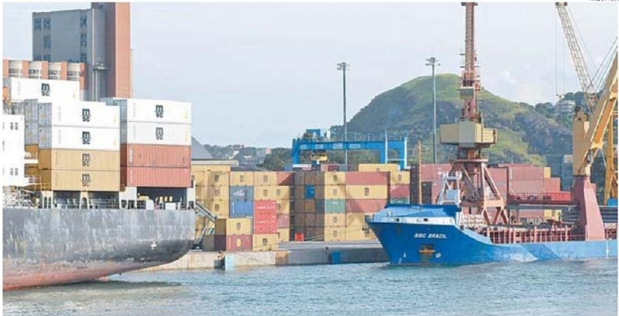
MOVIMENTAÇÃO DE CARGAS NO PORTO DE CAPUABA: empresas que ocupam áreas portuárias não poderão renovar os contratos indefinidamente

"Nos portos licitados, o processo está confuso, e o Tribunal de Contas da União já encontrou diversas irregularidades".