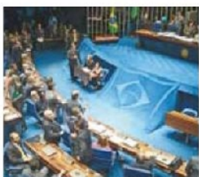
CONGRESSO NACIONAL: análise

“No mundo dos negócios não se pode voltar atrás. Sobre a Lei Portuária, houve quebra de contrato, e isto é caracterizado como um procedimento antiético, salvo em casos de necessidades extremas. Tem que haver mais transparên-